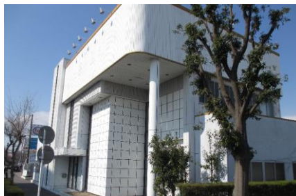
病院予定改装中(刈谷市昭和町) 5月中旬完工予定