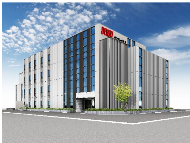
第4安城テクノビル(完成予想図) (安城市三河安城本町) 7月21日竣工予定