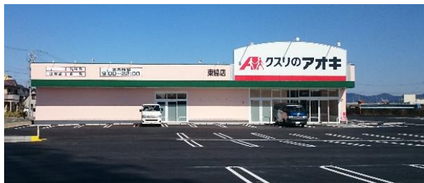
クスリのアオキ(豊橋市東脇) 2月28日竣工済

当社で携わっている物件です。その一部を紹介いたします。近くへお越しの節はご覧ください。