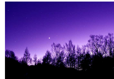
日本のチロル「下栗の里」と「しらびそ高原」