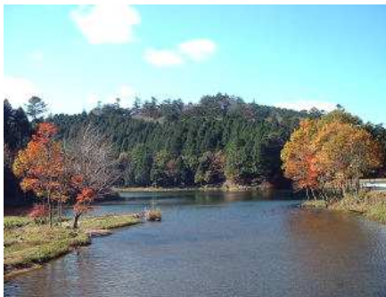
豊田市国道153号線伊勢神トンネル東に位置する段戸湖(裏谷高原)