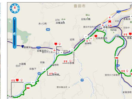
地図はHPからもダウンロードできます。交通不便な所も多い為、事前調査が必要です。