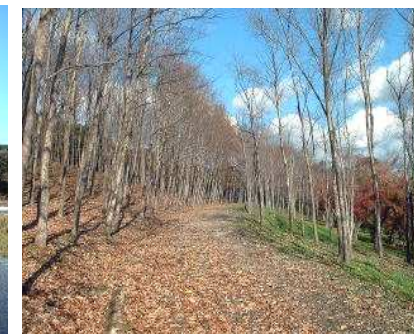
豊田市猿投地区の愛知県緑化センターに隣接する昭和の森