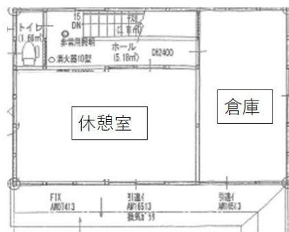
2階平面図 ※図面と現況が相違する場合は、現況を優先とします。